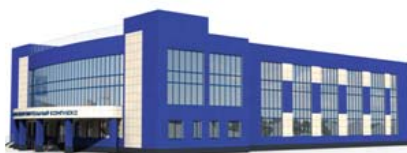
Физкультурно- оздоровительный комплекс, Великий Новгород