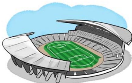
Новый стадион с футбольным полем, г. Валдай